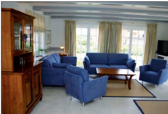
Wohnzimmer mit Kirschholz-Vitrine und Terrassentür zum Süden