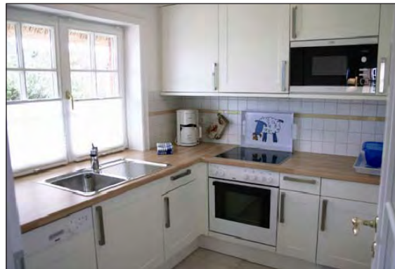
moderne, helle Einbauküche