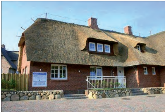
„Strandweg 3“ Nordseite mit Parkplatz und Hauseingang

Kontakt: Tel.: 05242-410844 • Fax: 05242-4108518 • E-Mail: sylt-pur@web.de • Homepage: www.rantum-sylt-pur.de