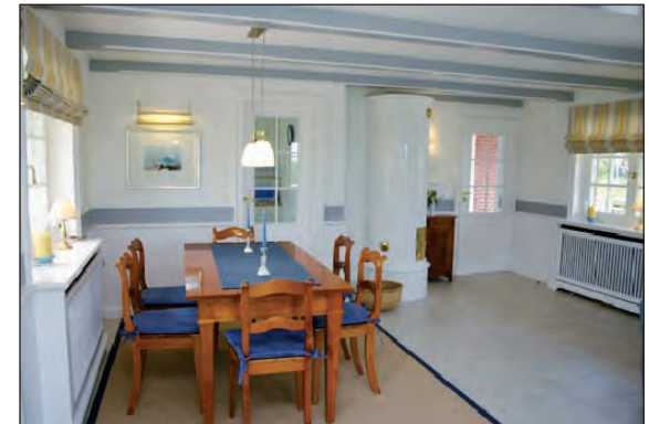
Essecke in Kirschholz und weißem Kachelkamin