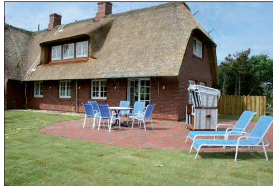
Großer Garten mit Süd-Terrasse