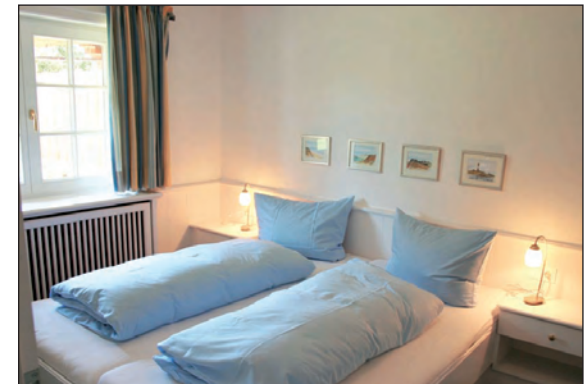
Doppelbett-Schlafzimmer im EG mit Bad