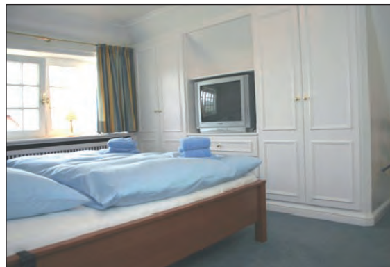
Doppelbett-Schlafzimmer im OG mit TV und Bad