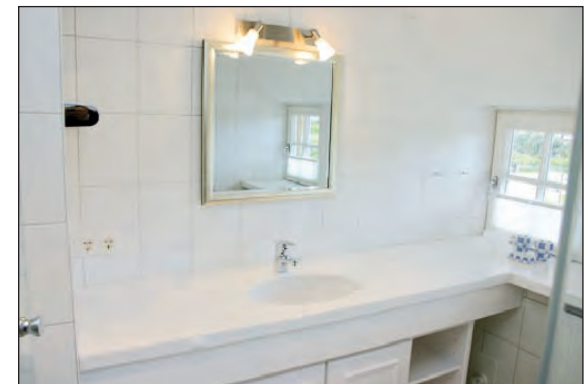
3 Bäder mit Dusche und WC