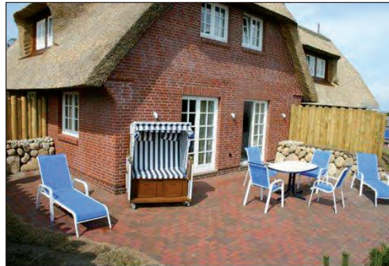
Garten mit Süd-Terrasse