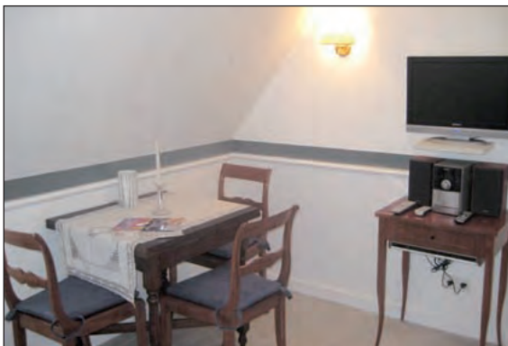
Essplatz und TV, Radio und CD/DVD-Player