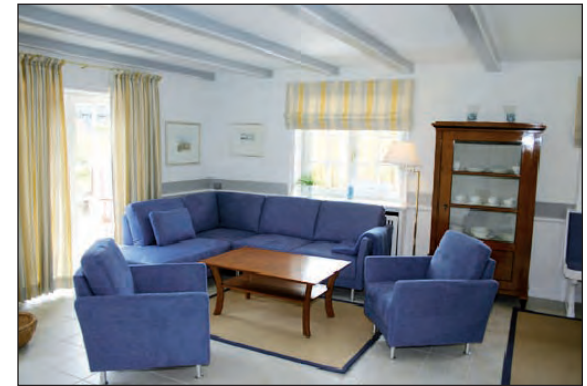
Wohnzimmer, Kirschholzschränk und Tür zur Südterrasse