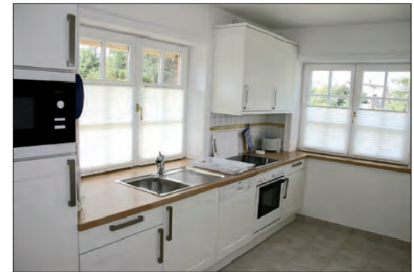
moderne, helle Einbauküche