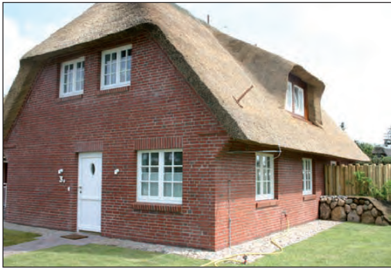
„Strandweg 3a“ Nord-West Ansicht mit Hauseingang

Kontakt: Tel.: 05242-410844 • Fax: 05242-4108518 • E-Mail: sylt-pur@web.de • Homepage: www.rantum-sylt-pur.de