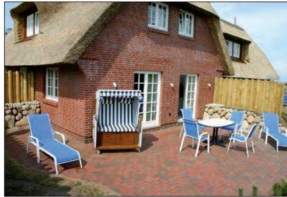
Garten mit Süd-Terrasse