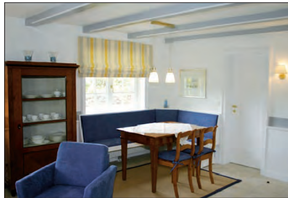
Essecke mit Eckbank und Kirschholz-Vitrine