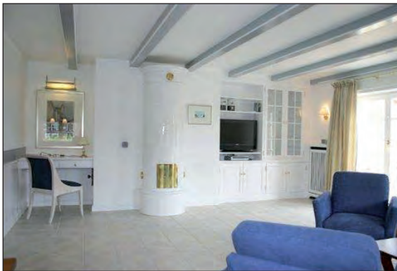
Wohnzimmer mit Kamin, Schreibplatz und Terrassentür