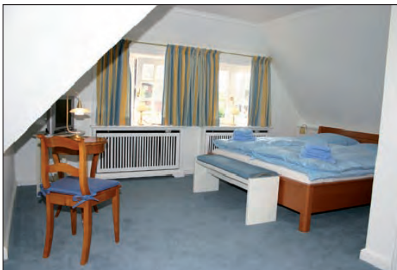
Doppelbett-Schlafzimmer mit TV und Bad im OG