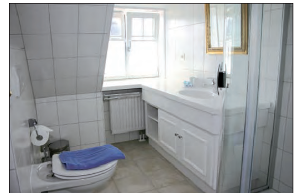
Zwei Bäder mit Dusche und WC im OG