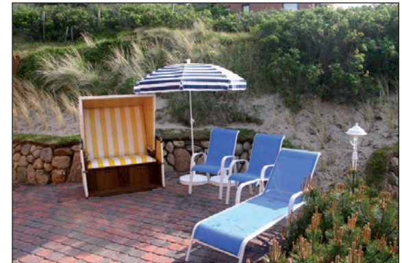
Gartenterrasse im Dünenbereich zum Süden