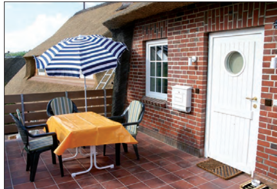
Eingang Ostseite mit eigener Frühstücksterrasse