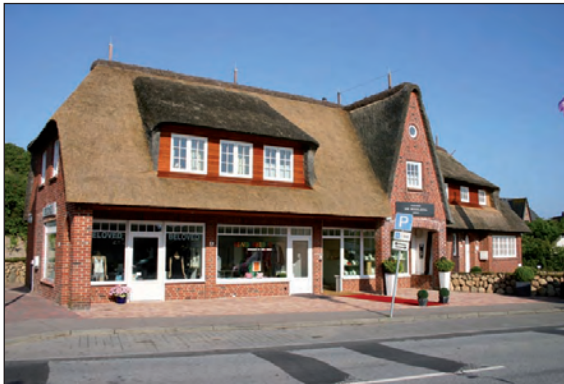
Wohnung im OG des Reetdachhauses Strandweg 8

Kontakt: Tel.: 05242-410844 • Fax: 05242-4108518 • E-Mail: sylt-pur@web.de • Homepage: www.rantum-sylt-pur.de