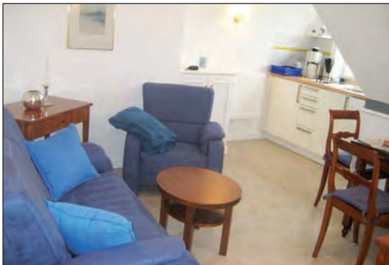
Wohnbereich mit Küchenzeile