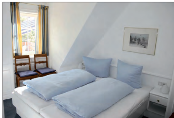
Doppelbett-Schlafzimmer mit Einbauschränk