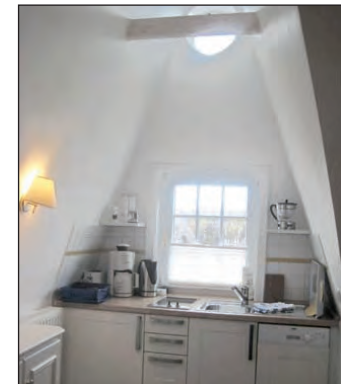
Küchenzeile mit offenem Dachbereich